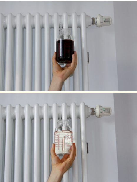
HEIZUNGSWASSER OHNE UMH HEIZUNGSWASSER MIT UMH

Gerne möchten wir über die Erfahrung mit den UMH-Heat-Geräten, welche wir in unsere zwei großen Häuser im Frühjahr 2011 eingebaut haben, berichten. Kürzlich wurden wiederum Wasserproben aus dem Heizungssystem entnommen. Wie schon bei früheren Inspektionen zeigte sich, dass das Heizungswasser völlig klar und schmutzfrei ist.